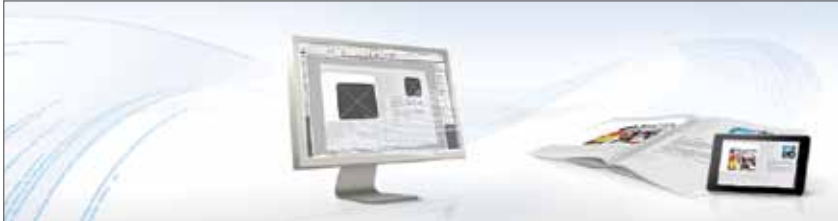
Abb. 3 Präsentieren Sie Ihre Printprodukte als APP auf dem iPad und anderen mobilen Endgeräten

Ergänzen Sie Ihre Printprodukte um funktionale eMedien mit Mehrwert. Wir bieten Ihnen innovative Lösungen für die eBook, ePaper, flipBook oder App-Erstellung – individuell auf Ihre Anforderungen abgestimmt. Wir haben uns spezialisiert auf die eBook-Aufbereitung im EPUB-Format. Nutzen Sie unser „Publishing Server Interface“ (PSI) zur schnellen und einfachen EPUB-Konvertierung.