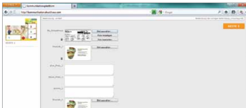
Abb. 2 Individualisieren Sie Ihr Printprodukt ganz einfach im Internet

Unsere Web to Print Lösungen helfen Ihnen die Prozesskosten Ihrer Druckprodukte zu reduzieren und garantieren eine durchgängige CI-konforme Produktion. Durch die integrierten Bestell- und Shopfunktionalitäten ist es möglich alle Produkte online zu kalkulieren und direkt zu bestellen. Mit unserem Web to Print System erstellen Sie Ihre Projekte direkt online und sparen sich somit die Kosten für die Anschaffung teurer Layoutsoftware.